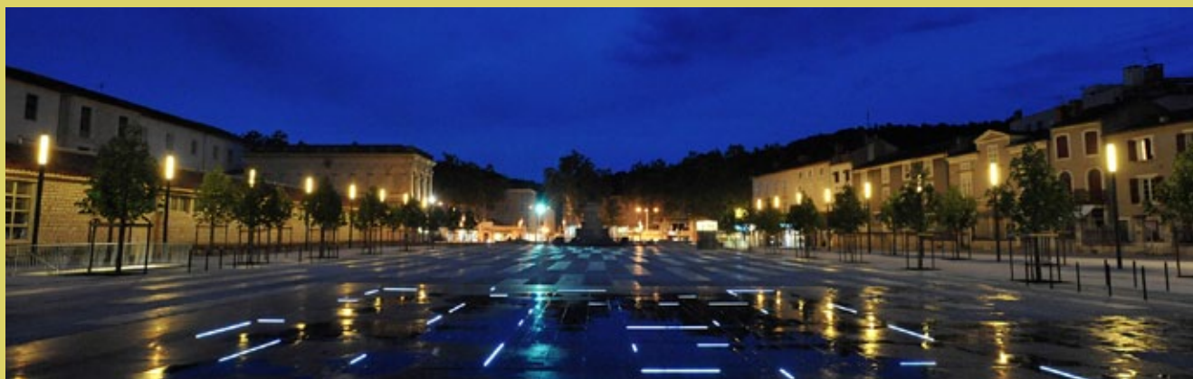
Allées Fénelon – ville de Cahors

Le commerce n'occupe qu'une place secondaire dans les SRDEII. Les régions soulignent toutefois leur préoccupation vis-à-vis du petit commerce et de l'artisanat dans un contexte de désertification commerciale des centres-bourgs et des cœurs de ville. Elles soutiendront la création ou la reprise de petits commerces, tant au titre de leur action en direction des petites entreprises que par souci de cohésion territoriale. Leurs interventions financières viendront compléter celles du bloc local et des chambres consulaires, qu'elles appellent à davantage de coordination.