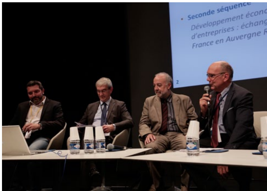
Rendez-vous régional Auvergne-Rhône-Alpes, 28 e convention nationale de l'intercommunalité, 5 octobre 2017, Nantes

Le législateur a confié aux communautés et spécifiquement aux métropoles un rôle de premier plan dans l'élaboration du SRDEII (consultation obligatoire et présentation en CTAP) et une place incontournable dans sa mise en œuvre (du fait des compétences créées ou transférées). Les régions ont repris à leur compte les intentions du législateur : les territoires ne doivent pas être « les simples réceptacles des dispositifs mis en œuvre » (SRDEII de Nouvelle-Aquitaine , p. 121), mais des partenaires. Plusieurs schémas affirment que la capacité d'initiative des communautés sera valorisée. La relation métropoles-communautés-région formerait un trio appelé à se professionnaliser selon le SRDEII d' Auvergne-Rhône-Alpes . Pour la région Bourgogne-Franche-Comté : « La dynamique de contractualisation économique territoriale ainsi ouverte aux EPCI ou à leurs groupements traduit la volonté de reconnaître le territoire avant tout comme un acteur et non comme un espace de mise en œuvre de la politique publique de développement économique » (p. 43). On s'attend donc à ce que ces déclarations se traduisent dans des partenariats constructifs et pérennes entre les régions et les communautés. Toutefois, ils seront assortis de certaines exigences de la part de régions.