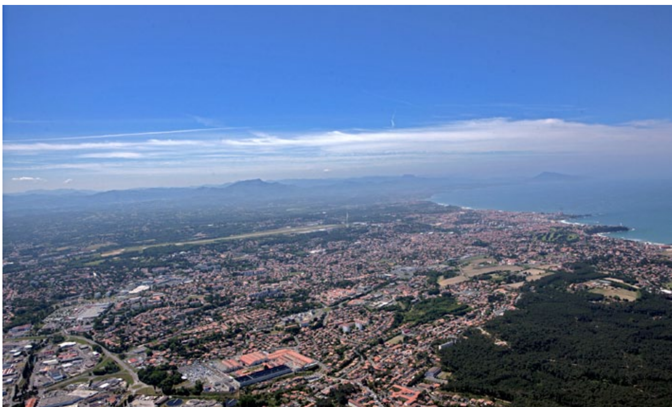
Communauté d'agglomération du Pays Basque

À titre d'exemple, l' Occitanie précise que « l'articulation de ce schéma avec les priorités et actions du CPRDFOP et du SRESRI contribuera à réaliser toutes les synergies utiles et à éviter que les jeunes, les entreprises, les salariés et les demandeurs d'emploi ne se trouvent face à des lacunes ou des redondances pour l'accompagnement de leurs projets » (p. 2). La Normandie a mené conjointement l'élaboration du SRDEII et du SRESRI. La région Provence-Alpes-Côte d'Azur indique que « les orientations du SRDEII constitueront un cadre stratégique pour un certain nombre de politiques régionales » (p. 142) : le SRESRI, le CPRDFOP, le SRDT et le SRADDET « s'inscriront dans le cadre de la stratégie élaborée dans le SRDEII » (p. 142). Les SRDEII prennent également en compte d'autres documents comme le contrat de plan État-région, les pactes de ruralité et les programmes opérationnels pour le déploiement des fonds structurels européens (FEDER et FSE).