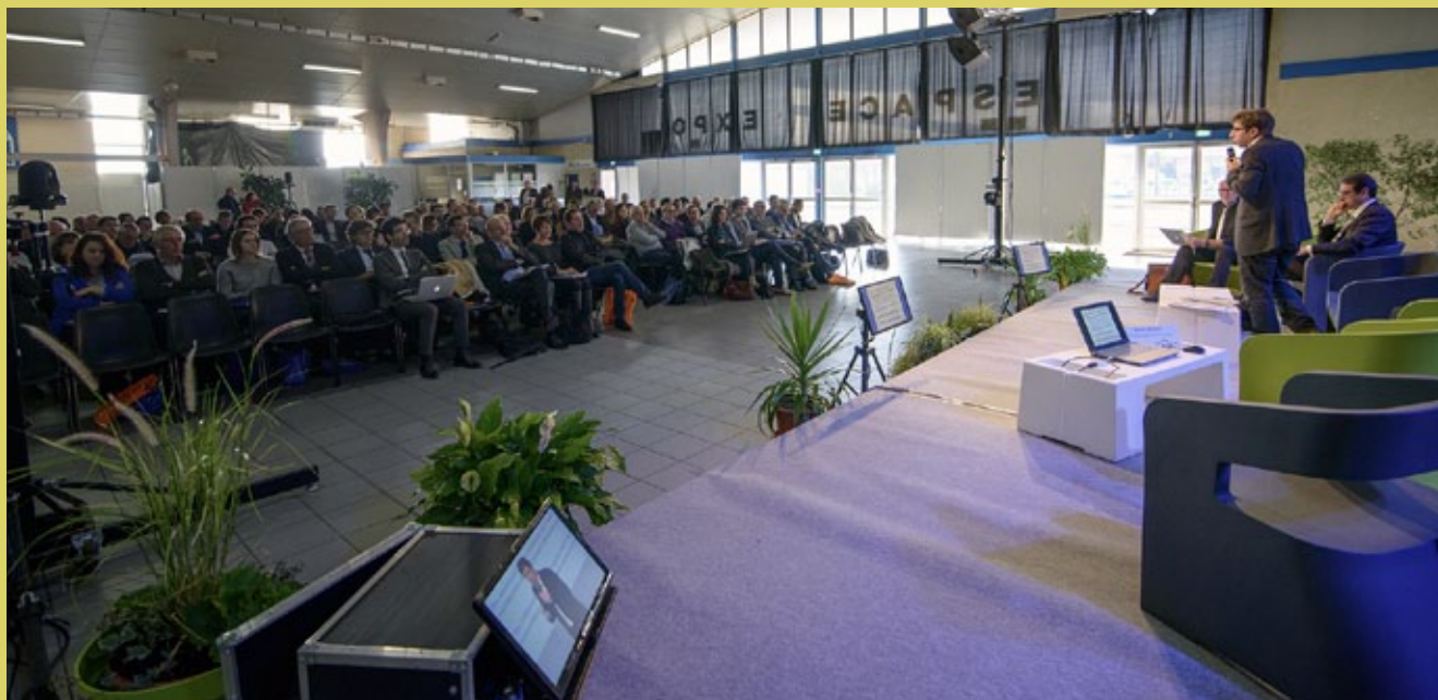
Rendez-vous régional, Val de Garonne, Nouvelle-Aquitaine, 14 décembre 2016

La gouvernance du SRDEII est abordée dans plusieurs schémas. La majorité des régions propose la mise en place d'instances ad hoc pour en assurer le suivi. Ces instances feront participer les différents acteurs associés à la concertation préalable et ceux plus largement impliqués dans la vie économique. Les stratégies régionales se voulant partenariales, elles permettent aux parties prenantes d'observer, d'évaluer, de proposer et, le cas échéant, d'améliorer l'action régionale. Ces instances doivent s'assurer du dynamisme de la stratégie économique régionale et de sa capacité à s'adapter aux évolutions conjoncturelles.