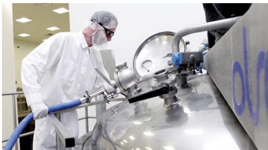
Communauté d'agglomération de Cergy-Pontoise

Les politiques de filière, traditionnellement l'apanage de l'État, pouvaient être critiquées en ce qu'elles traduisaient une approche par trop cloisonnée de l'économie. Toutefois, préparer les mutations sectorielles, développer une politique d'excellence ou s'appuyer sur des filières locomotives du développement régional sont autant d'arguments que les régions sollicitent pour légitimer leur intervention ciblée dans quatre secteurs : l'industrie, l'agroalimentaire, le tourisme et la silver économie.