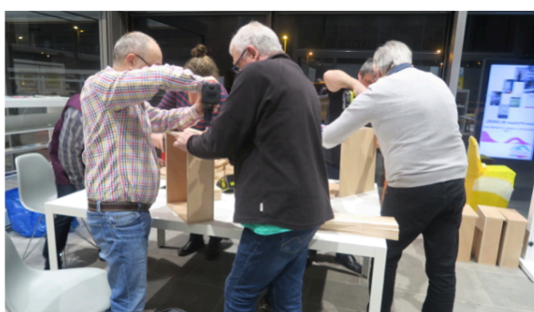
« La médiathèque dont vous êtes le héros » : Médiathèque Intercommunale entre Dore et Allier ( Lezoux )

Des équipements publics comme les EHPAD, si durement touché par la Covid19, peuvent aussi se rapprocher du processus Tiers-Lieu. Le projet CALME mené au gérontopôle Serre-Cavalier- CHU à Nîmes se positionne de manière très pertinente dans cette logique d'innovation publique et sociale. Il s'agissait de « penser la transformation de la résidence d'un lieu de soin vers un lieu de vie ; d'un lieu où l'on loge vers un lieu où l'on habite ». Cette expérience portée par des chercheurs et des designers s'est déroulée dans un lieu où l'hospitalité et l'habitabilité s'inscrivent dans un cadre réglementaire strict. Dès lors, comment composer entre une « une forme verticale, institutionnelle, salubre, cependant insuffisante pour garantir l'équité de traitement ou la qualité d'accueil. Comment alors assurer la continuité et le développement d'une démarche solidaire plus horizontale ? » Cette expérience symbolise bien ce dialogue à construire entre un cadre institutionnel descendant