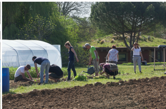
Le 100° Singe à Escalquens - Sud de Toulouse