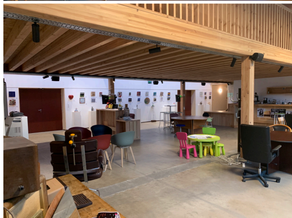
La Quincaillerie « numérique » - Communauté d'agglomération du Grand Guéret

intégrant en son sein la radio locale. La démarche est longue, lente et la Quincaillerie sensibilise, éveille à une autre culture par cercles concentriques diffus et est un des épicyclics du réseau Tela , réseau des Tiers Lieux creusois. Pour que ce lieu puisse exister, il y a bien eu dialogue, adaptation entre les principes du Tiers-Lieu et les impératifs de l'institution publique. C'est ce segment bénéfique qui peut assurer qu'une collectivité locale dispose d'un équipement, service public, producteur de biens communs, diffusant une culture de la résilience au plus près des habitants.