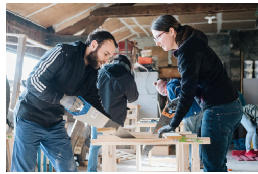
L'Hermitage à Autrèches

et pour le renforcement de leur modèle économique si fragile. Le télétravailleur bénéficiera d'un environnement épanouissant où la convivialité, l'interaction sociale, l'apprentissage entre pairs et la convergence des énergies peuvent cristalliser une autre culture du travail plus résiliente