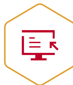
Schéma directeur énergie et Plan pluriannuel d'investissement Planifier les investissements nécessaires à la rénovation de votre patrimoine éducatif. Arbitrer et prioriser en fonction des capacités financières de votre collectivité. Prise en charge à 100 %.

Affecter vos financements et planifier vos investissements.