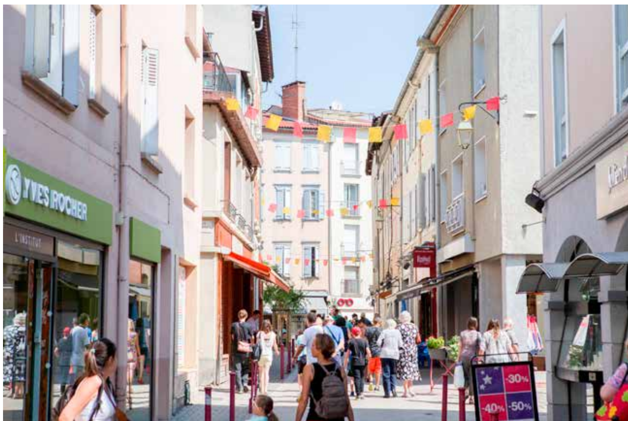
Scheiber Frédéric - Région Occitanie

La première phase pilote permettra de définir ses périmètres d'interventions en adéquation avec les politiques urbaines locales. 17 territoires concernant 20 communes ont été retenus pour cette première étape de déploiement de FOCCAL (voir carte en pages 10 et 11).