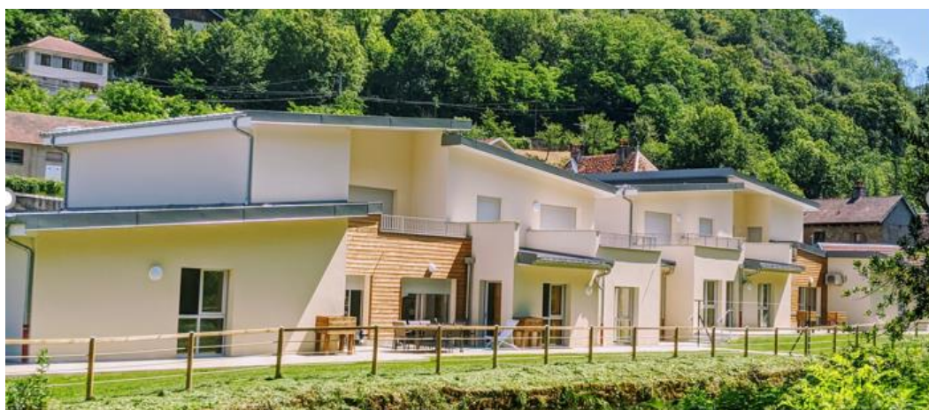
Maison Ages&Vie ouverte en 2021 à Beure

A la mi-année 2021, Ages&Vie est en ligne avec son plan de développement ambitieux. 17 nouveaux projets en VEFA (vente en l'état futur d'achèvement) viennent ainsi d'être signés par la Foncière Ages&Vie. Cette SCI, créée en mai 2019, en partenariat avec Korian, la Banque des Territoires (qui en détient 35%) et Crédit Agricole Assurances (35%), soutient le développement immobilier du réseau de maisons Ages&Vie. Les 17 projets signés portent à 87 l'ensemble des projets de cette foncière, soit plus de la moitié des quelque 150 qui seront réalisés au total sur l'ensemble du territoire français.