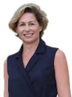
Nathalie Delattre Sénatrice de la Gironde Vice-présidente du Sénat Présidente d'honneur d'Alliance Villes Emploi