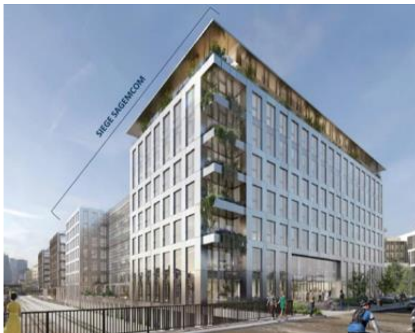
Photo non contractuelle - Investissements ne constituant aucun engagement quant aux futures acquisitions.

La Française Real Estate Managers (REM) et la Banque des Territoires ont acquis en VEFA auprès d'AXA IM Alts, agissant pour le compte de ses clients, un immeuble de bureaux d'une surface de 20 275 m 2 dont la livraison est prévue en juin 2023.