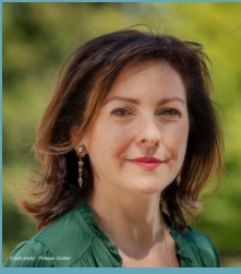
Carole DELGA Présidente de la Région Occitanie

« Depuis plus de 60 ans, la CACG est un acteur incontournable de l'eau. Partenaire majeur des territoires, son action permet un partage équitable de cette ressource grâce notamment à la gestion des aménagements et des ouvrages hydrauliques.