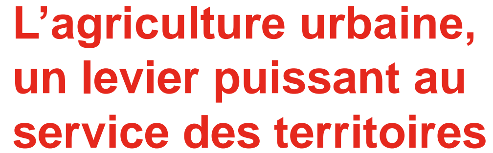
Table ronde #1