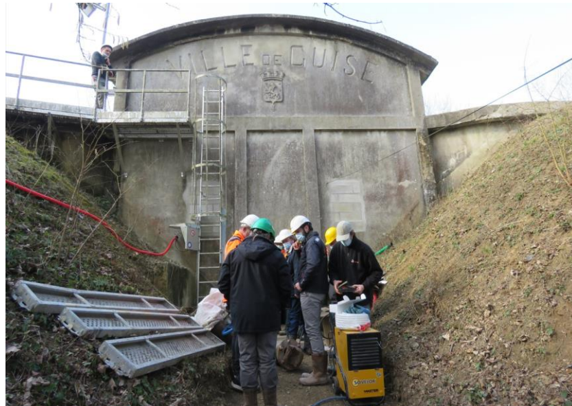
Guise rénove un réservoir d'eau pour sécuriser son approvisionnement (02)