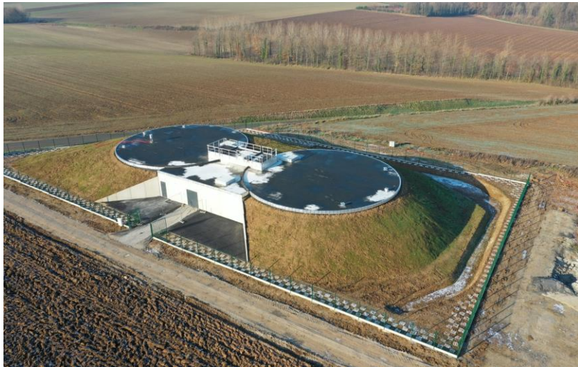
Des forages interconnectés pour éviter la coupure d'eau (62)