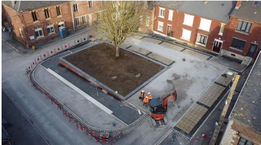
Des espaces publics pensés pour l'infiltration des pluies à Moncornet (02)