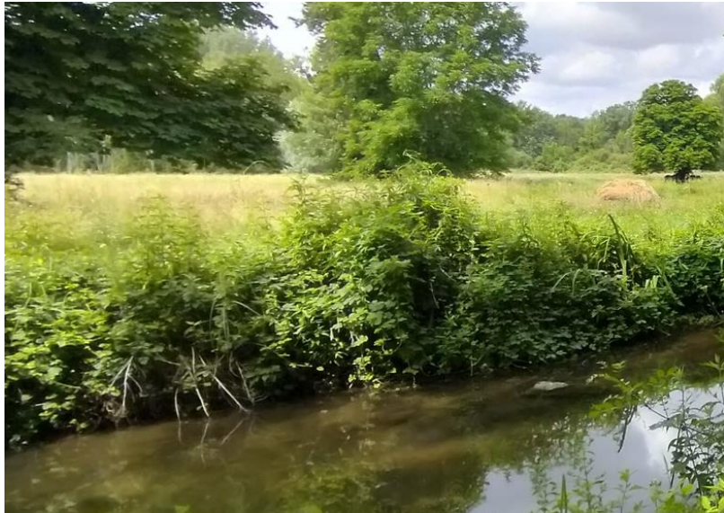
Restauration de la zone alluviale de Malaguet (86)