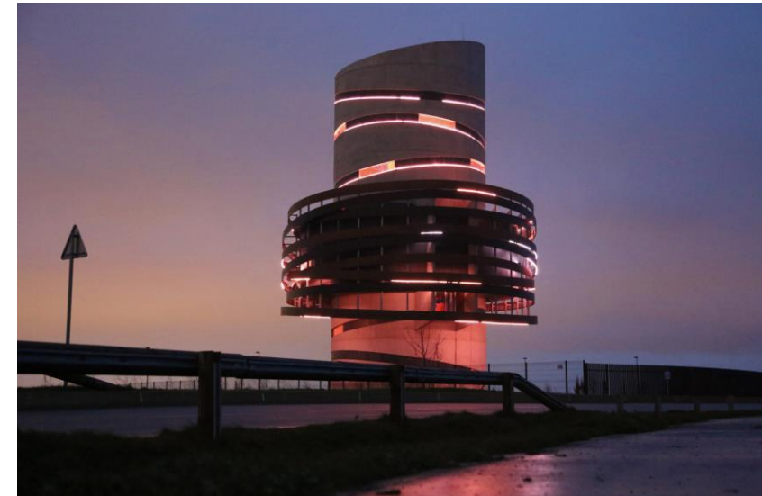
Le renouveau des châteaux d'eau à la Communauté d'agglomération de Lens-Liévin (62)