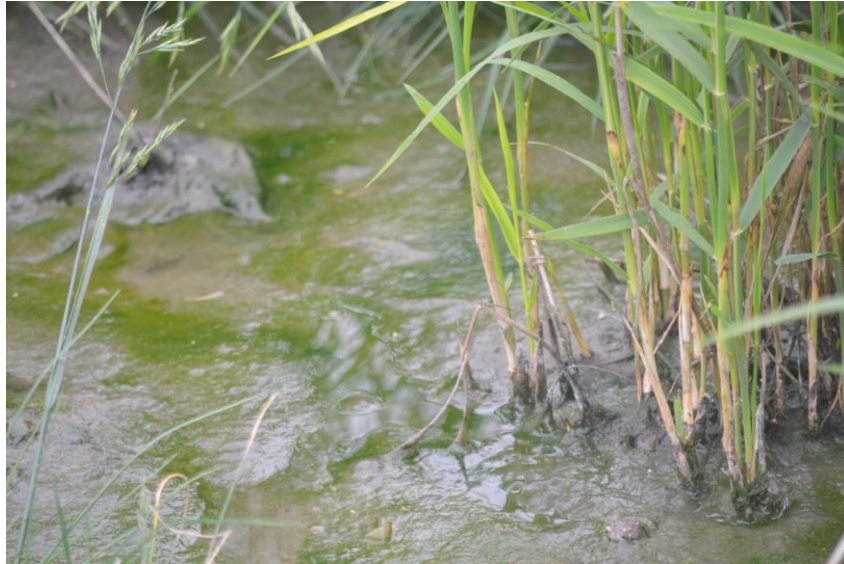
Epuration des eaux usées : le pouvoir des roseaux (80)