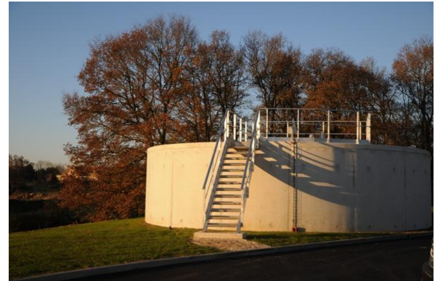
Interconnexion de grande ampleur dans le Bonnevalais (28)