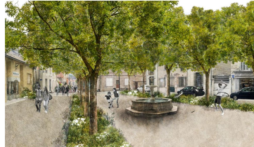
A Chinon, la place Mirabeau va réintroduire la biodiversité en cœur de ville (37)