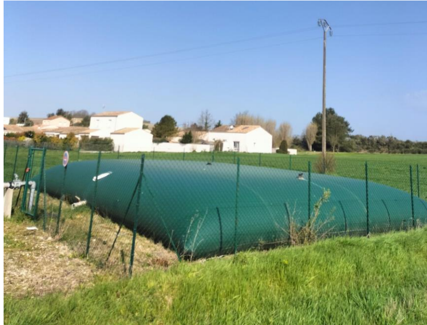
Installation d'une citerne à incendie dans la commune de Sémussac (17)