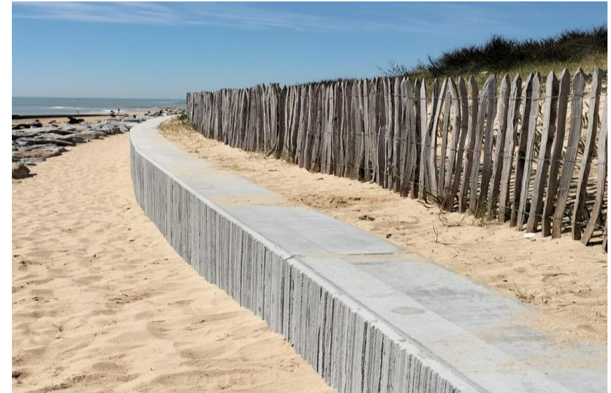
Reconstruction de la digue de Montamer – Ile de Ré (17)