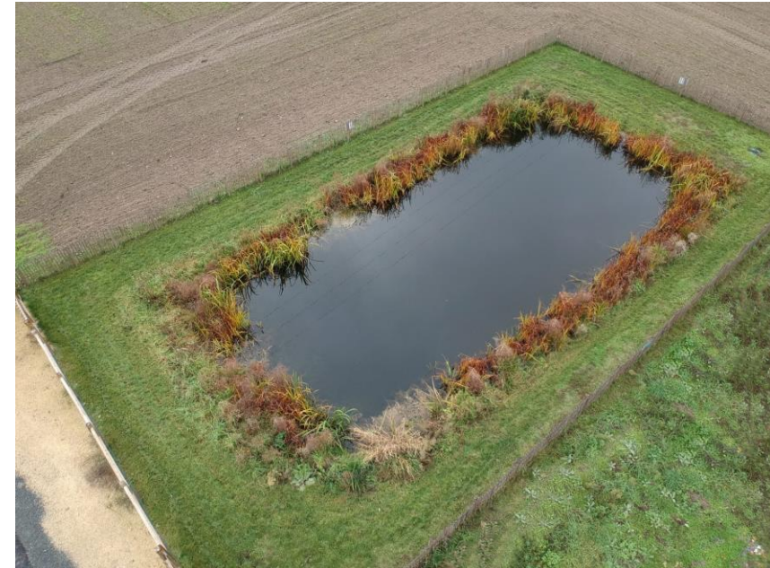
Une mare paysagée comme réserve incendie sur un site protégé (37)