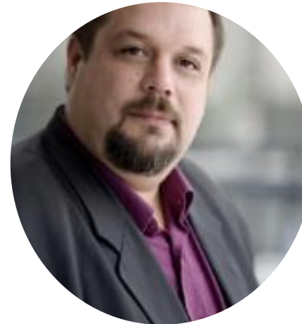
Frédéric Molossi Président l'Association Nationale des Élus des Bassins (ANEB)