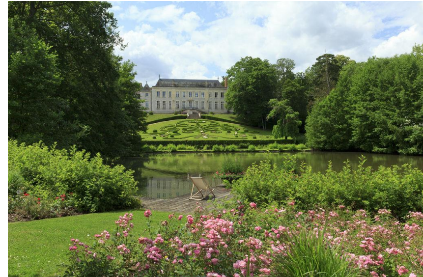
Orléans métropole traite l'eau d'une station d'épuration pour arroser son Parc Floral (45)