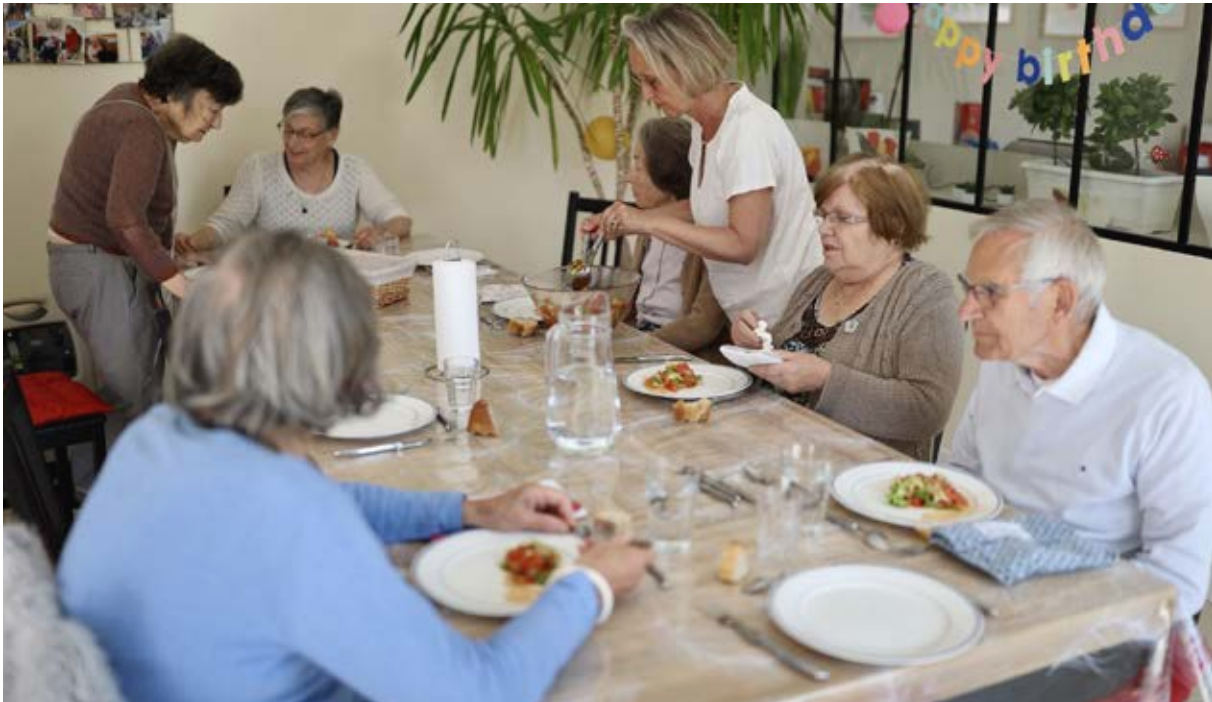
La maison des sages