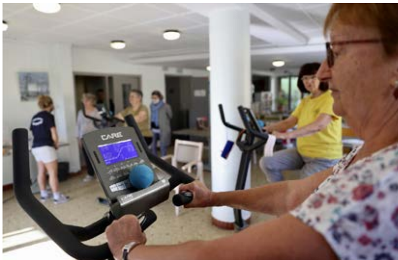
© Nadine DUPREY - ID 76 CC BY-ND 2.0