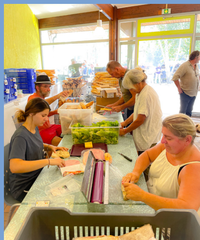
Domaine départemental d'Hostens, ouvert par le CD33 pour la restauration des personnels engagés dans la lutte contre l'incendie de Landiras. 2000 repas quotidiens, matin midi soir et nuit.

Le Département 33 a donc ouvert le domaine départemental d'Hostens le 8 août avec pour mission de préparer 300 repas/jour pour 500 SP. Quatre jours plus tard, 1600 SP étaient sur place, ainsi que des militaires, des gendarmes, la DFCI, nécessitant la confection de 2000 repas matin, midi et soir, mais aussi de nuit. Un camp de base s'est ainsi créé spontanément, coordonné jour et nuit par des agents et élus départementaux, ainsi que des bénévoles.