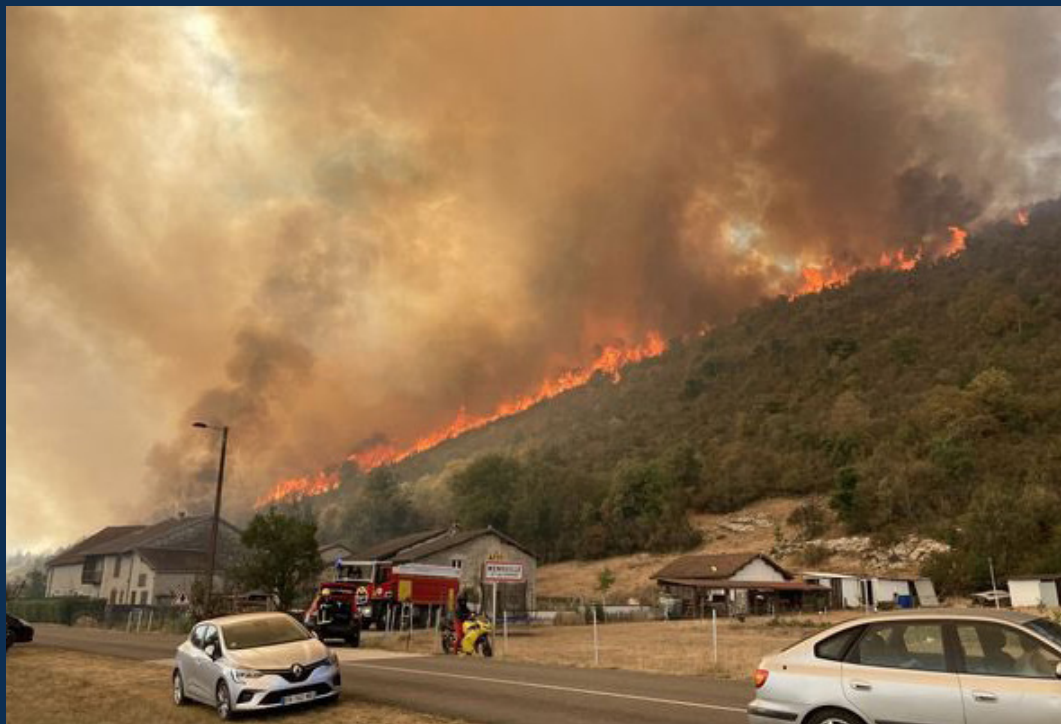
Cernon, 11 août 2022