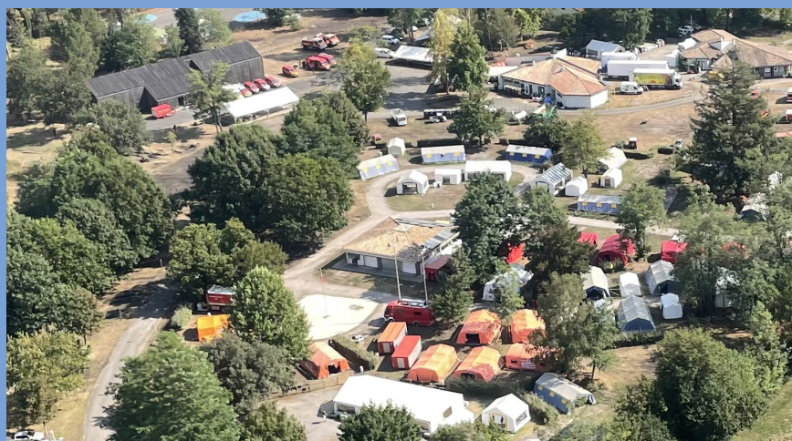
Domaine départemental d'Hostens

Le transport sanitaire et la gestion des personnes évacuées non autonomes (hospitalisations à domicile, respirateur, ...) exigent, de la même façon, des soutiens, si possible extérieurs au SDIS (ARS, Département...).