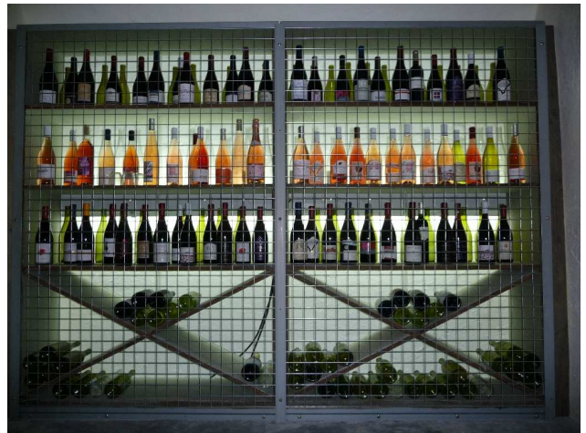
© Médiéval / CCOR La Cure