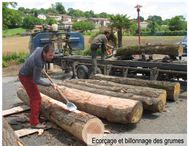
Ecorçage et billonnage des grumes

Si le scieur avait pu rester plus longtemps, il aurait pu continuer à scier pour d'autres clients qui se sont manifestés.