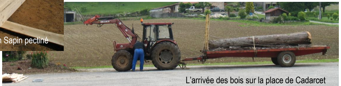
L'arrivée des bois sur la place de Cadarcet