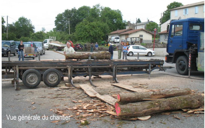
Vue générale du chantier