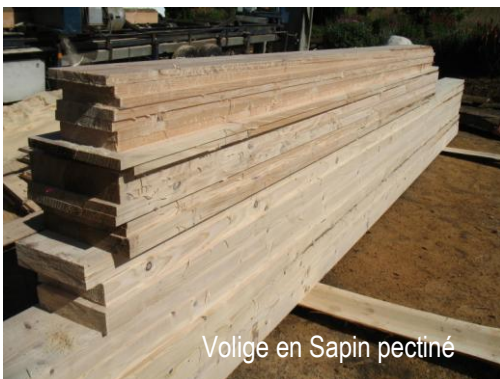
Volige en Sapin pectiné