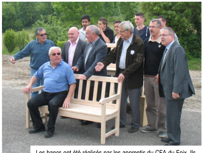
Les bancs ont été réalisés par les apprentis du CFA du Foix. Ils sont en frêne, châtaignier et acacia.

Exemple de réalisation avec le bois de la commune, scié à la scie mobile lors d'une précédente fête du bois.