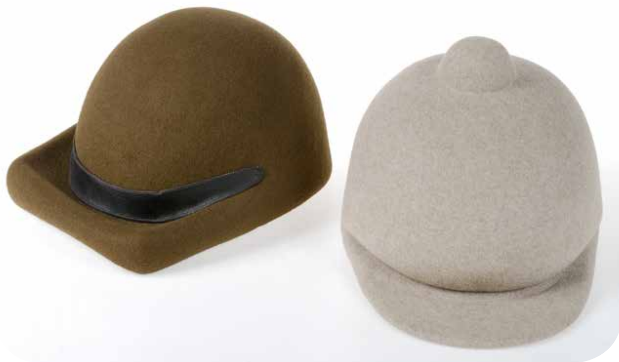
casquettes Pierre Cardin La Chapellerie Atelier-Musée du Chapeau