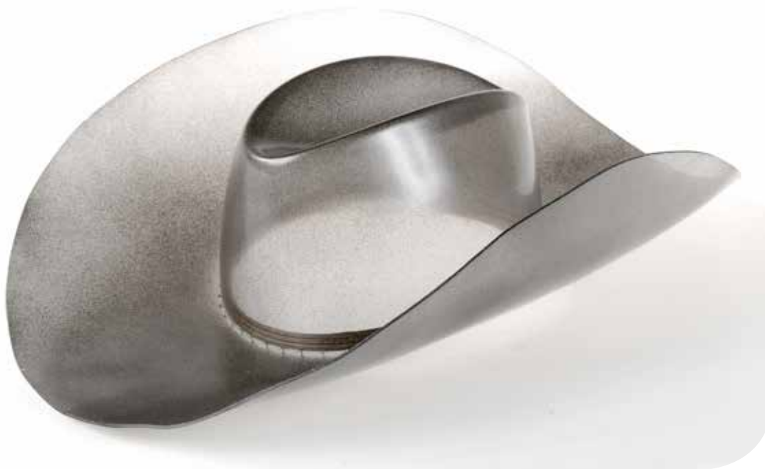
en haut : création Stephen Jones en bas : création Paco Rabanne La Chapellerie Atelier-Musée du Chapeau