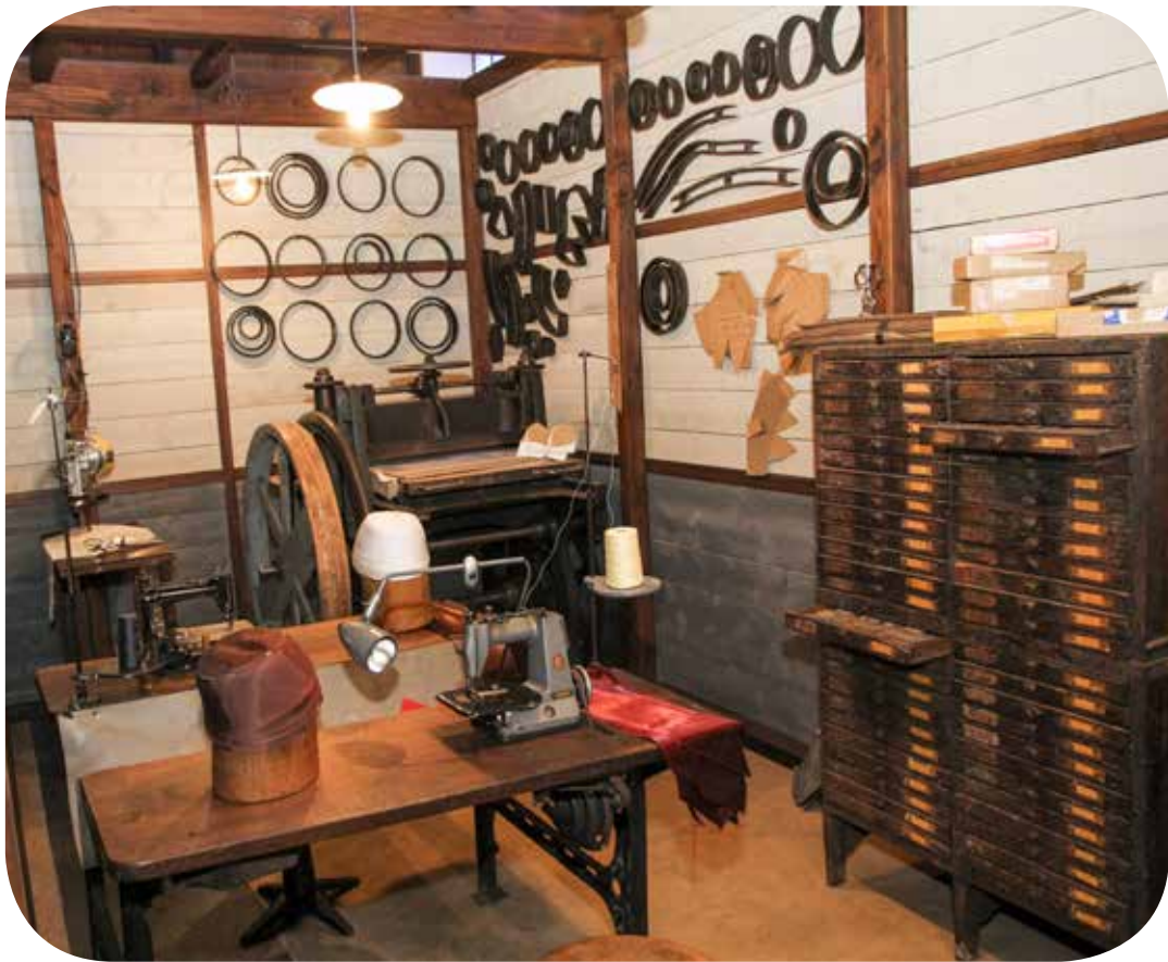
en haut : atelier de bastissage en bas : atelier de doreur sur cuir La Chapellerie Atelier-Musée du Chapeau