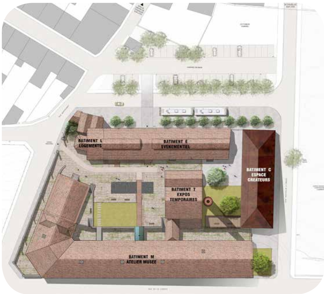
en haut : vue de la cour centrale qui organise l'ensemble des bâtiments autour La Chapellerie Atelier-Musée du Chapeau © Daniel Ulmer en bas : plan général © Pierre Vurpas et associés architectes