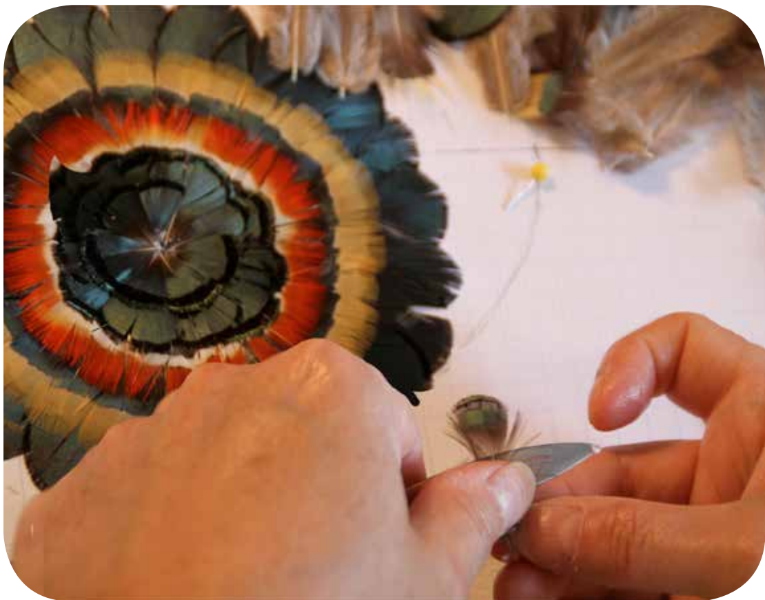
en haut : stage de patronage en bas : stage de garnissage en plume La Chapellerie Atelier-Musée du Chapeau