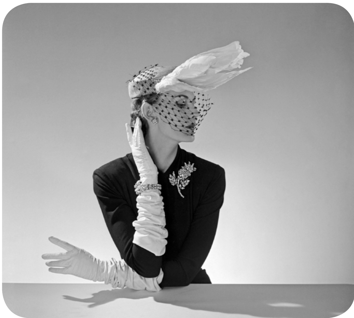
création Jacques Fath, Paris 1951