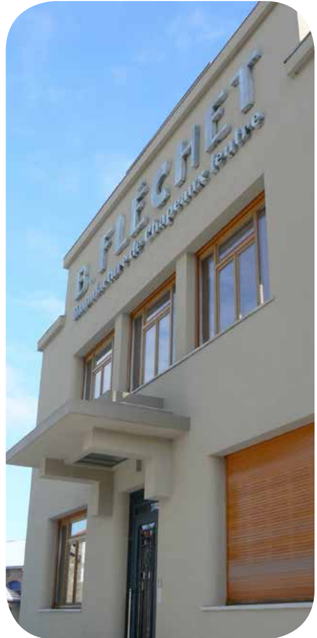
La façade du bâtiment de l'administration, de style Art Déco © Pierre Vurpas et associés architectes

Communauté de communes Forez-en-Lyonnais Zone de Montfuron 42140 Chazelles-sur-Lyon ccfl@cc-forez-en-lyonnais.fr Tél : 04 77 54 28 99 Fax : 04 77 54 37 72