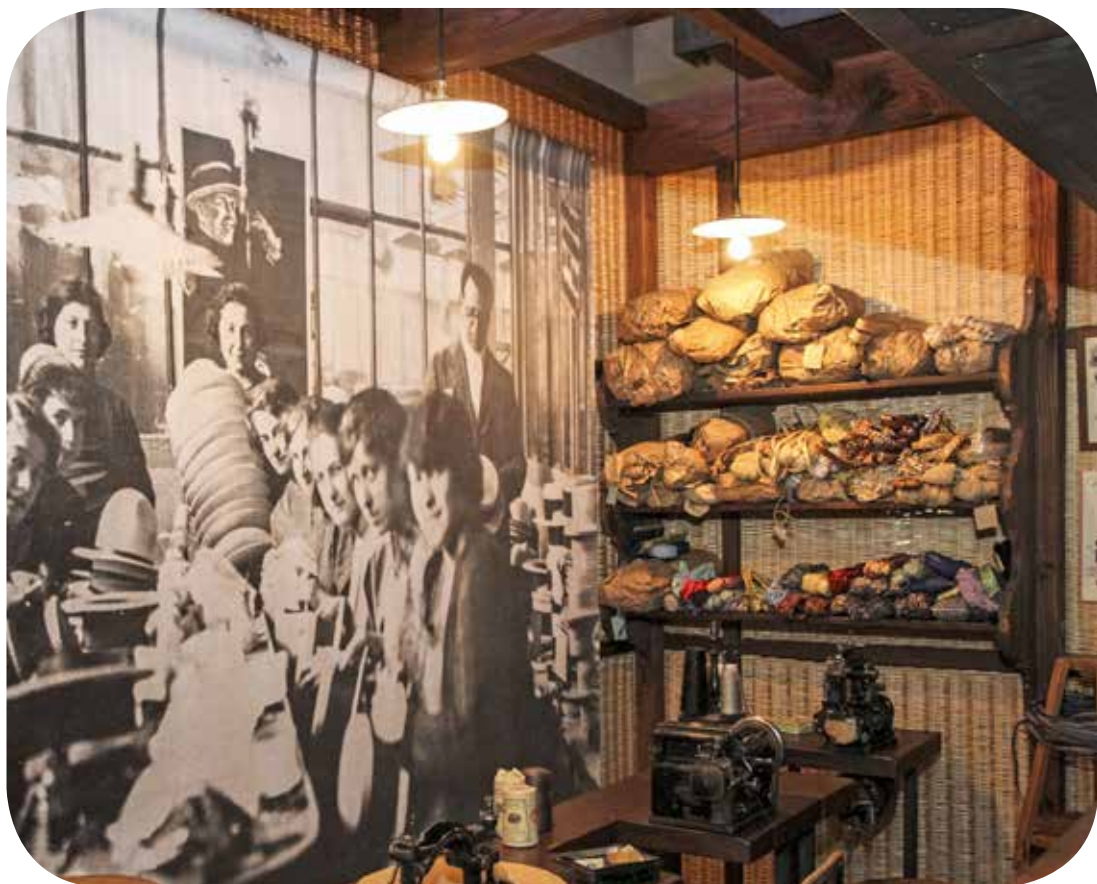
en haut : atelier de bichonnage en bas : atelier de paille La Chapellerie Atelier-Musée du Chapeau