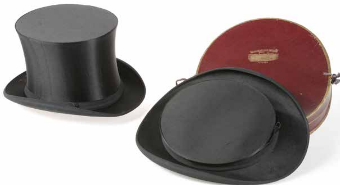
Gibus La Chapellerie Atelier-Musée du Chapeau