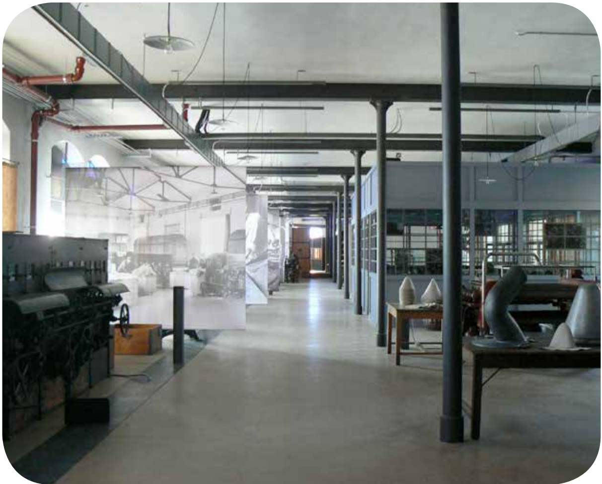
en haut : la Chapellerie vue de l'extérieur en bas : la chaîne de fabrication du chapeau, du poil de lapin au chapeau de feutre © Pierre Vurpas et associés architectes