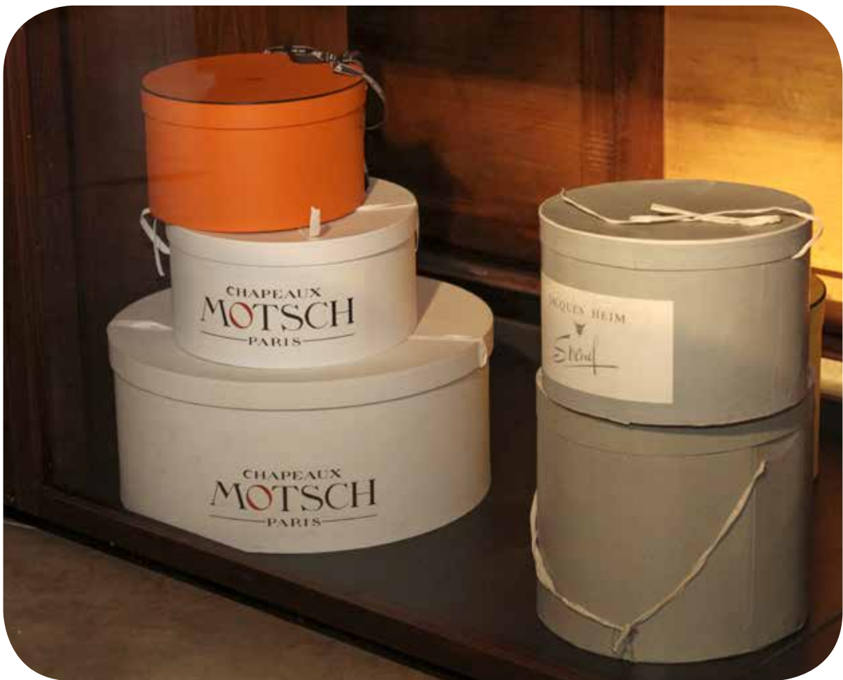
en haut : atelier d'appropriage en bas : détail de la vitrine Chapellerie Bruyas La Chapellerie Atelier-Musée du Chapeau