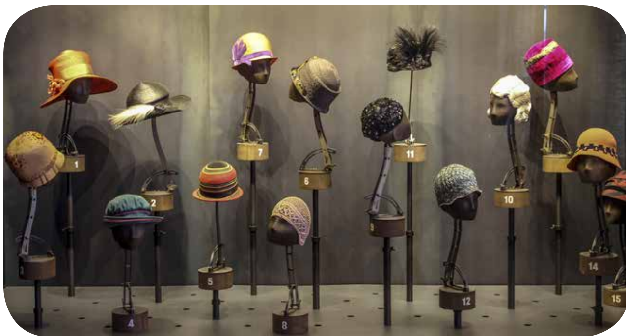
vitrine 1920-1929, Atelier-Musée du Chapeau

Week-end inaugural les 6 et 7 avril 2013