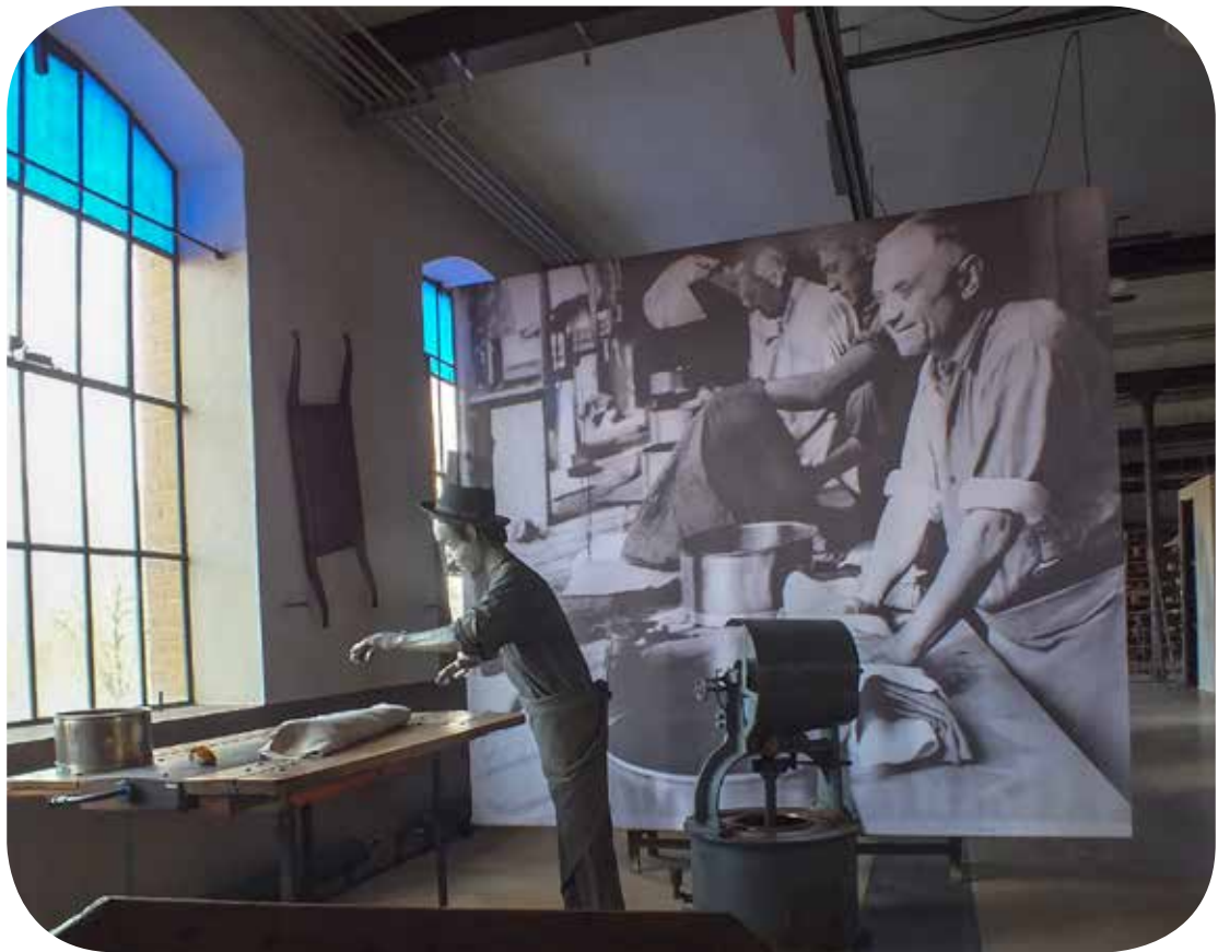
en haut : atelier de teinture en bas : atelier de semoussage La Chapellerie Atelier-Musée du Chapeau