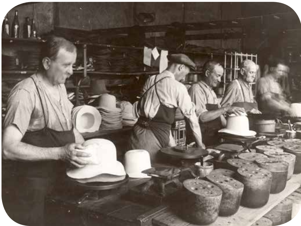
en haut : le foulage mécanique en bas : le pelotage