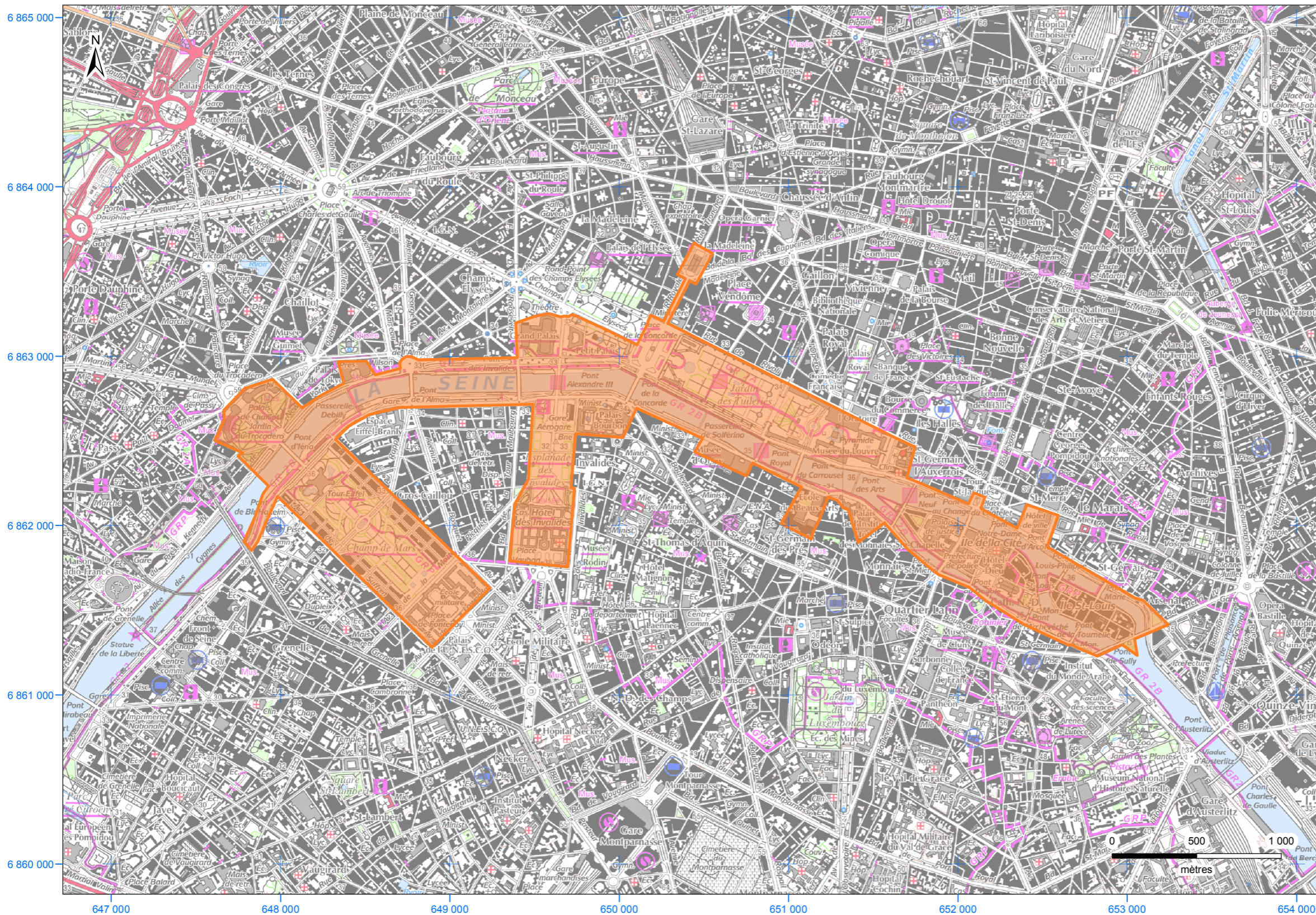
localisation du département de Paris (n° INSEE : 75)