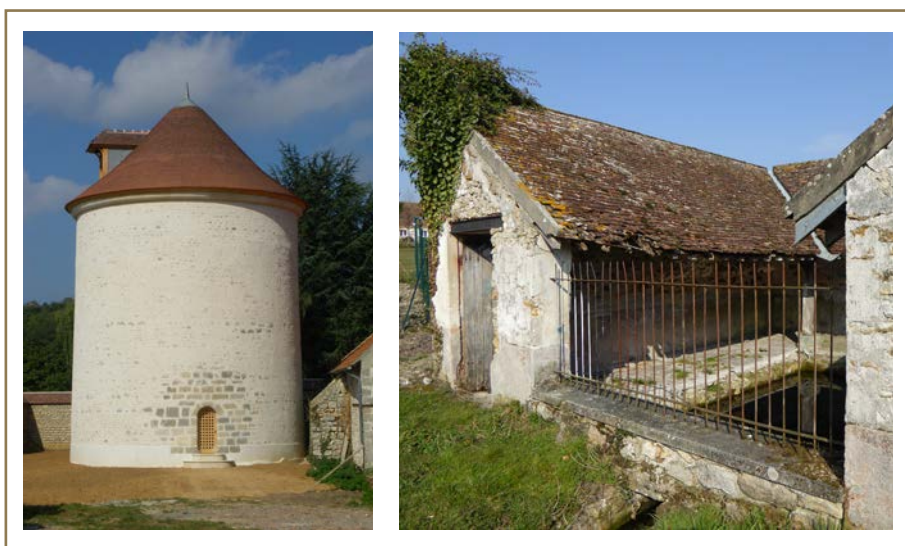
Colombier de Brières-les-Scellés en Essonne et lavoir de Touquin en Seine-et-Marne

Afin d'encourager le mécénat des particuliers et des entreprises qui se mobilisent en faveur des projets de restauration du patrimoine francilien non protégé, la Région Île-de-France a souhaité apporter une aide décisive aux souscriptions lancées par la Fondation du patrimoine : chaque euro collecté par la Fondation sera désormais abondé d'un euro par la Région, dans la limite de quinze mille euros par projet. Ces dispositions sont formalisées par une convention de partenariat.