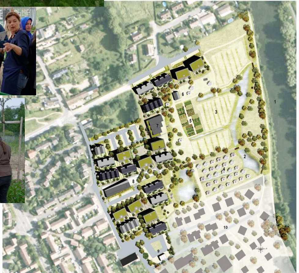
1- L'Eure 2-Zone à caractère humide 3-Zone maraichère 4-Verger 5-Jardins familiaux 6-Maison des jardiniers 7- Crèche 8- Place du marché 9-Chaufferie bois 10-Zone d'extension future